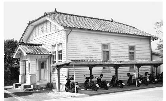
同窓会館として整備予定の旧図書館

100周年記念実行委員会は、去年の4月22日の第一回の会を開催し、去年、今年と毎月第2火曜日に、大口高校会議室で回を重ね、今年4月で12回開催しております。委員会は、会長、副会長、幹事を含め45名のメンバーで、広報渉外、寄付会計、式典祝賀会、記念工事、記念誌の分科会を作り、毎月議論を重ねています。100周年事業を行うに一番大事な、同窓会名簿を皆様のご理解とご協力により令和元年版を作成する事ができました事を感謝申し上げます。前回の名簿作成は、平成9年度版が最後で、個人情報管理の問題や予算の関係で作成できませんでしたので、今回は、実に22年ぶりの作成になりました。名簿も皆様のご協力により、かなり精査された名簿が出来上がり、これからの同窓会の活動にも活躍してくれそうです。その名簿の作成時に続き、創立100周年事業のご寄付のお願いを、まことに恐縮ですが、今回改めてお願いいたします。 100周年記念事業実行委員会、協議を重ねて参りまして、同封の募金趣意書をお願いすることになりました。また、委員会でお振込みの面倒を少しでも簡単にとの思いから、皆様のお名前を記載したバーコードで確認が出来るようにいたしましたので、皆様のご浄財をお願いいたします。 記念事業の内容も、前回の「忠元」に掲載いたしました内容を