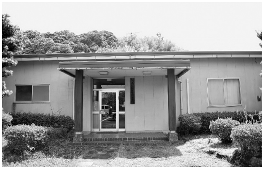
防災拠点として整備予定の鴻志寮